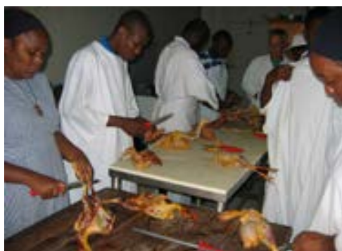
Formation à la boucherie