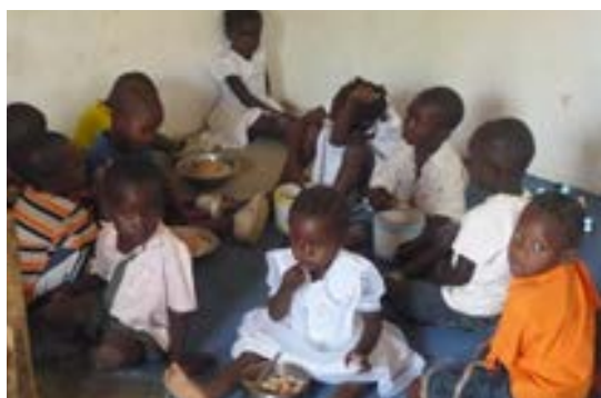
Le repas des grands dans un centre de nutrition

En 2015, avec le soutien de la fondation Cécile Barbier de la Serre et de Saint Gobain, l'AFU a financé ces centres à hauteur de 96 000 euros. En 2016, l'AFU voudrait aider la Fraternité à réparer ou réaménager certains centres qui en ont besoin, acquérir du nouveau matériel et si possible s'ouvrir à de nouvelles localités qui en font la demande. Nous aurions besoin de 120 000 euros.