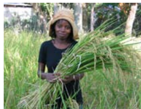
Une agricultrice cultivant le riz